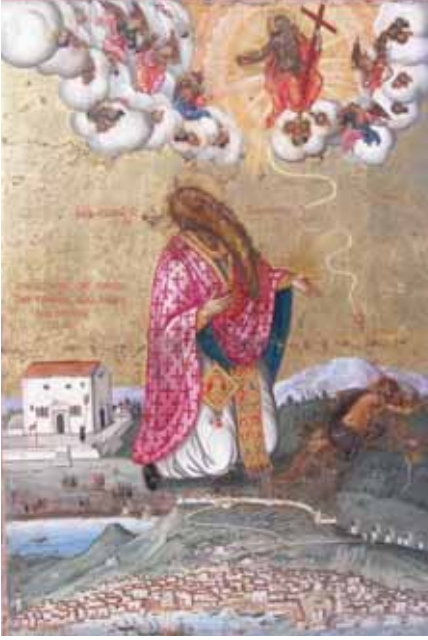
Εικ. 1. Ζάκυνθος. Ναός του Αγίου Χαραλάμπους στο ποτάμι. Εικόνα του αγίου Χαραλάμπους ( Ν. Καλέργης, 1732).