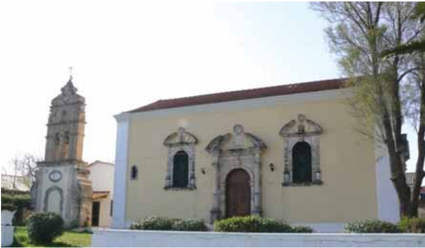
Εικ. 3. Ζάκυνθος. Ο ναός του Αγίου Χαραλάμπους στο ποτάμι όπως είναι σήμερα. Βόρεια όψη.