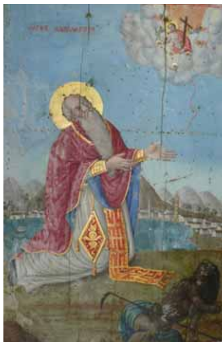
Εικ. 7. Ζάκυνθος. Ναός της Παναγίας της Ντούσενας και του Αγίου Χαραλάμπους στην πόλη. Εικόνα του αγίου Χαραλάμπους (1747-1757;).