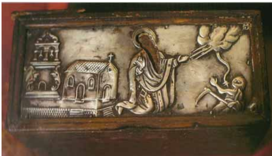
Εικ. 10. Ζάκυνθος. Ναός του Αγίου Χαράλαμπος στο ποτάμι. Κιβωτίδιο με αργυρόγλυπτη επένδυση.