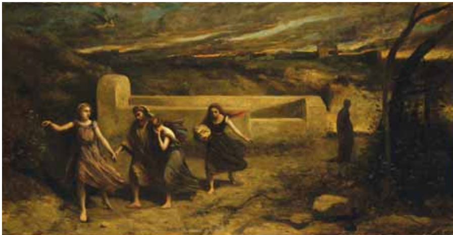
Jean-Baptiste-Camille Corot (1796-1875), «The Destruction of Sodom», λάδι σε μουσαμά.

Ίσως αυτό είναι και το μυστικό της δύναμης του εν λόγω Ηθικού ρεαλισμού: Επικαιροποιεί τα διαχρονικά στοιχεία του γλωσσικού θησαυρού ατόμων και ομάδων, της ανθρωπότητας. Και καλεί τον καθένα να υιοθετήσει την δέουσα στάση (και) έναντι της πανδημίας αναθυμούμενος το θεμελιώδες κοινό των ανθρώπων – την εν λόγω υποκειμενικότητα.