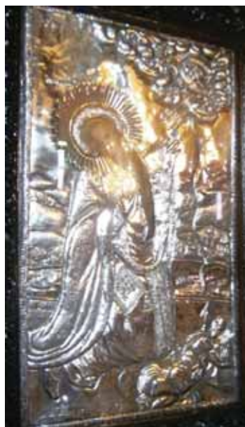
Εικ. 9. Φιλιατρά. Ναός του Αγίου Χαραλάμπους. Εικόνα προσκνηταρίου του αγίου Χαραλάμπους (β' μισό 18ου αιώνα;).