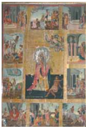
Εικ. 8. Χίος. Ναός της Κοιμήσεως της Θεοτόκου Λατομιτίσης. Εικόνα του αγίου Χαραλάμπους (Ιωάννης Κοράης, 1744).