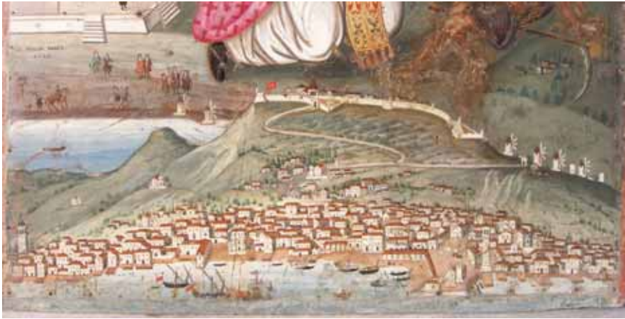
Εικ. 4. Ζάκυνθος. Ναός του Αγίου Χαραλάμπους στο ποτάμι. Εικόνα του αγίου Χαραλάμπους. Λεπτομέρεια (Ν. Καλέργης, 1732).