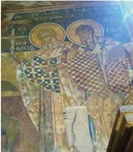
Εικ. 5. Κέρκυρα. Ναός του Αγίου Αθανασίου στην Άνω Κορακιάνα. Οι άγιοι Αθανάσιος και Σπυρίδων εκδιώκουν την πανώλη (1747).