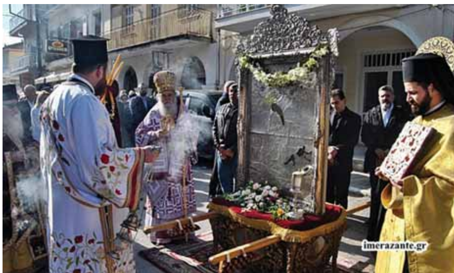
Εικ. 11. Ζάκυνθος. Από την λιτανεία της εικόνας του αγίου Χαράλαμπος στις μέρες μας (10/2/2019).