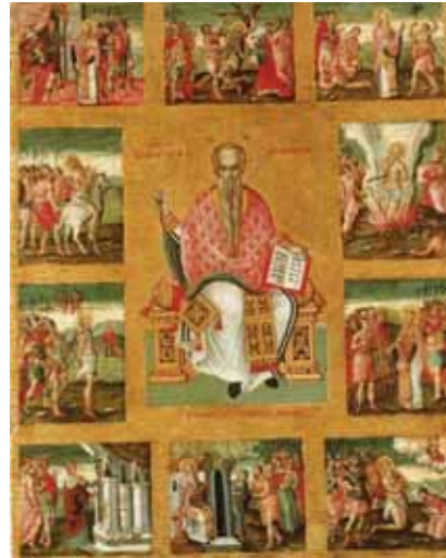
Εικ. 6. Μουσείο Ζακύνθου. Εικόνα του αγίου Χαραλάμπους με σκηνές του βίου του (Ν. Καλέργης, 1728).